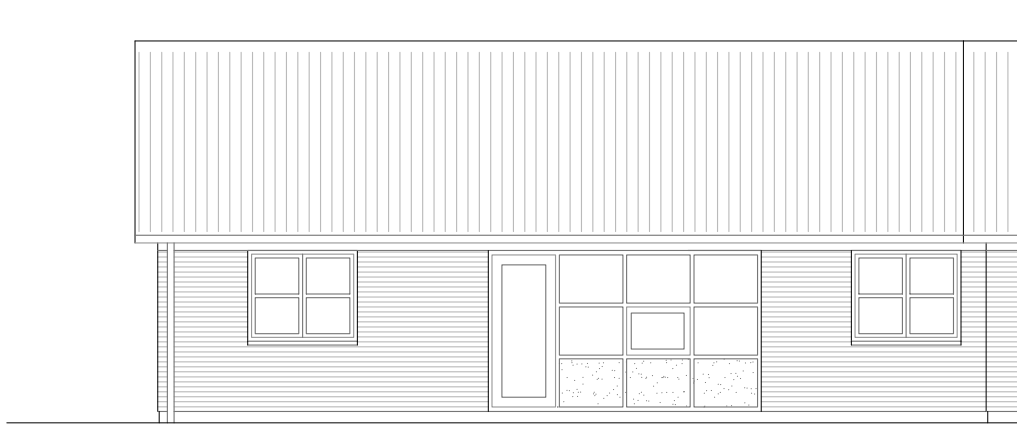
Facade mod stue